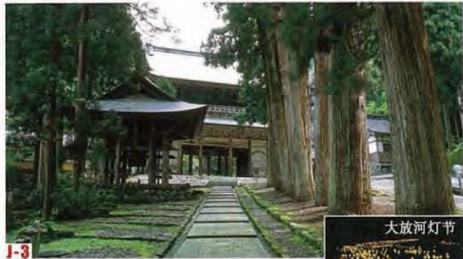
永平寺 (永平寺町) 约760年前由遣元禅师创建的出家参禅的道场。 ☎(0776)63-3102