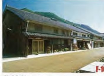
熊川宿 (若狭町) 始于江户时代的重要驿站。被确定为国家级重点保护传统建筑群。 ☎(0770)62-0330 ◎“驿站”休息日 每周一