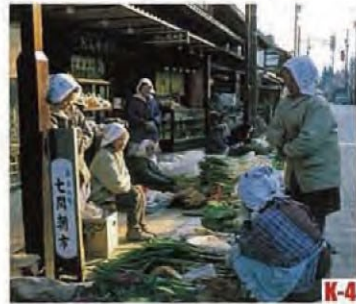
七间早市 (大野市) 这里的早市400年前就开始了, 一直是老百姓的膳食中心。 ◎举办期间 春分至12月31日