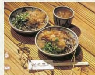
越前萝卜泥芥麦面 品尝在刚捞出来的荞麦面上倒上有萝卜泥的独特汤汁的一品。