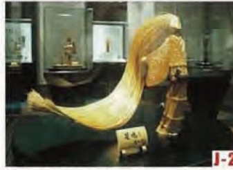
越前竹偶人之乡 (坂井市) 陈列出不少以歌舞伎等为题材而制成的竹偶人和竹工艺品。 ◎休息日 12月26日至31日