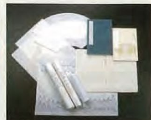
越前和纸 越前和纸具有1500年的历史，以最高品质的和纸而著称。