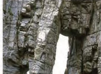
苏洞门 (小滨市) 波涛海浪形成的礁石、洞窟千奇百态, 景色极为壮观。