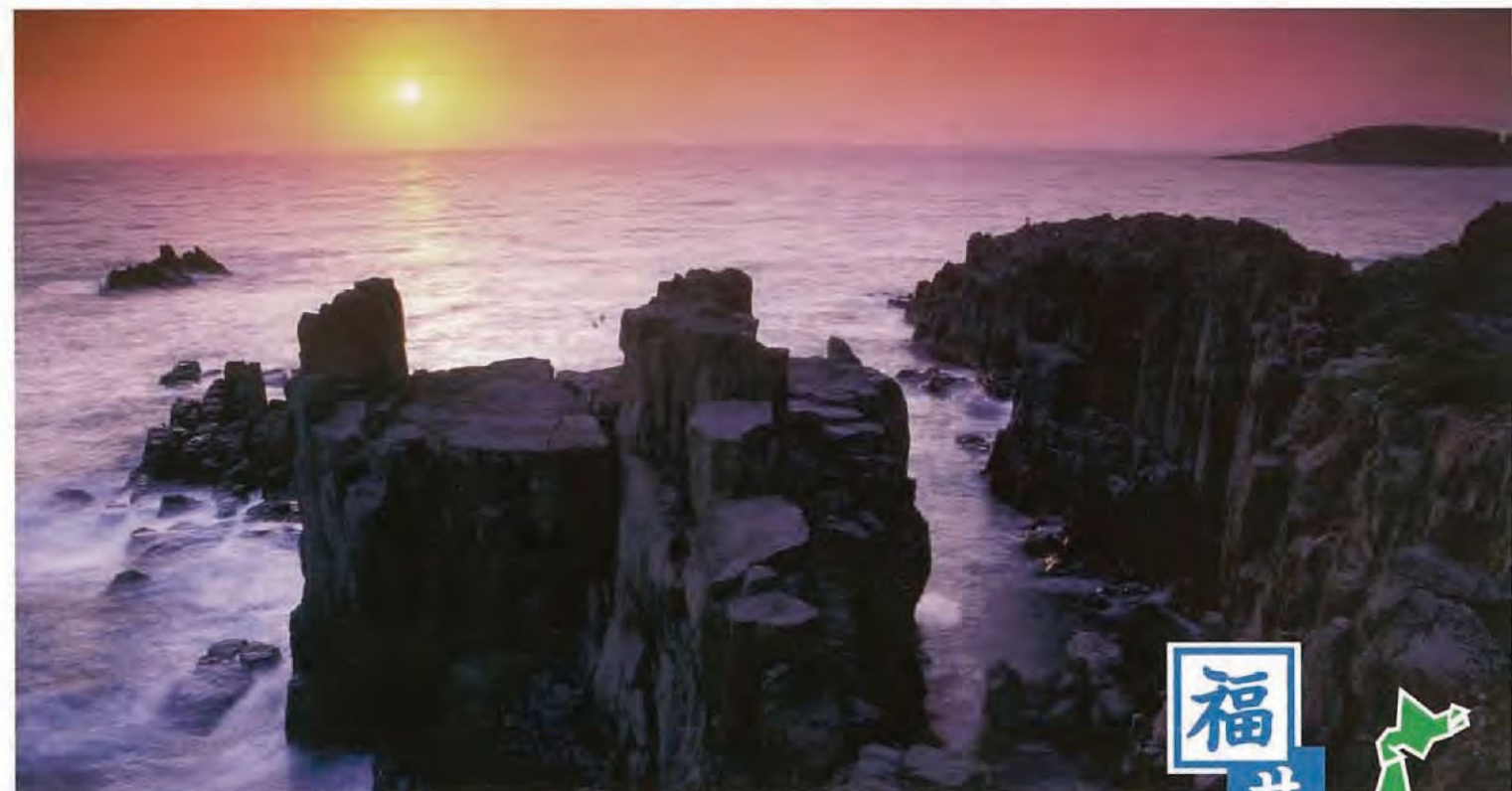
国家天然纪念物·东寻坊