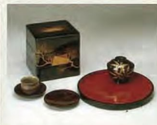
越前漆器 据传越前漆器起源于遥远的6世纪左右，其造型优雅，工艺精美，得到好评。