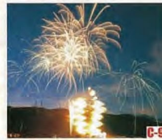
若狭大饭镇火节 (大饭町) 火把游行, 大火势的火把呈现树形状。充满幻想的仲夏夜活动。 ◎举办日期 8月上旬