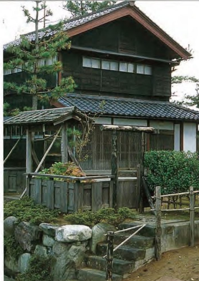
鲁迅先生的老师——藤野严九郎的纪念馆