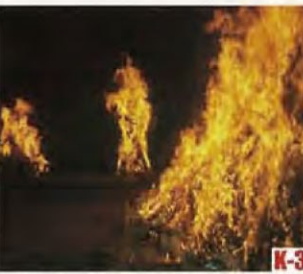
胜山左义长节 (胜山市) 自从平安时代流传的活动之一, 在元宵节那天举行的奇特镇火活动。 ◎举办日期 2月最后的周六、周日