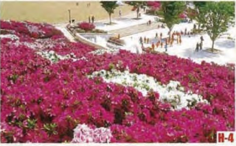
西山公园 (鯖江市) 约4万6千棵杜鹃花争妍斗艳, 是日本海一侧屈指可数的杜鹃花景观。站在展望台上, 可以眺望观赏远方的白山连峰。 ◎杜鹃花盛开之时 4月下旬至5月上旬 ☎(0778)51-1001