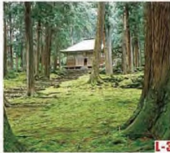
平泉寺 白山神社 (胜山市) 修验道三大圣地之一。参拜路被指定为“日本道路一百选”, 因为杉树和绿苔的幽香被确定为“香气风景一百选”。 ☎(0779)88-1591