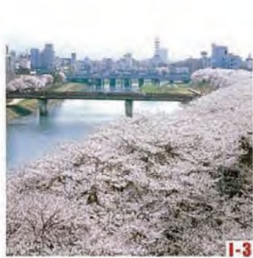
足羽河原・足羽山 (福井市) 樱花树并列绵延2.2公里, 被确定为“樱花名胜一百选”。 ◎樱花盛开之时 4月上旬