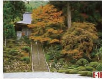
万德寺 (小滨市) (红叶景点一百选) 有国家指定为名胜的庭园, 春季的杜鹃和秋季的红叶最值得一看。 ◎红叶似火之时 11月中旬至11月下旬 ☎(0770)66-2308