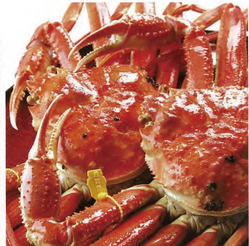
冬天最具有代表性的时鲜——越前螃蟹