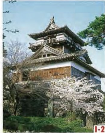
丸冈城 (坂井市) 日本最古老的太守阁展望楼, 樱花盛开时会看到梦幻般的景色。是国家指定建筑物。 ☎(0776)66-0303