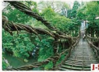
蔓草桥 (池田町) 蔓草桥是跨越足羽川溪谷的正式的木制吊桥, 全长44米, 在桥上感觉凉爽宜人。