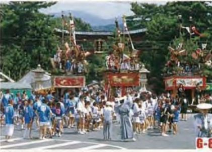
敦贺节 (敦贺市) 自从室町时代流传下来的节日游行彩车, 别具特色的活动中心广场及狂欢节游行等, 镇上充满着节日的欢乐气氛。 ◎举办日期 9月上旬