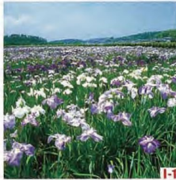
北海湖畔玉蝉花园 (芦原市) 北海湖畔的玉蝉花园闻名全国。从5月下旬起大约一个月内, 约300种50万株的玉蝉花一齐竞相怒放。6月下旬还隆重举行玉蝉花会, 很是热闹。