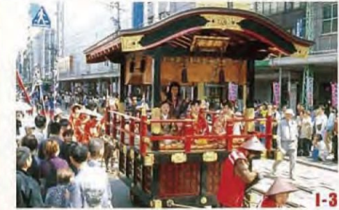
越前时代行列 (福井市) 每年4月上旬, 身着战国时代的英雄和武士服装的人们, 踏着整齐的步伐浩浩荡荡地穿行于市内中心地区, 再现勇武时代的壮观风景。 ◎举办日期 4月中旬