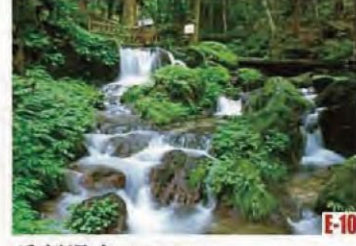
瓜割瀑布 (若狭町) 自古作为神泉受到尊崇, “名水一百选”。这一带是若狭瓜割名水公园。 ☎(0770)62-0186