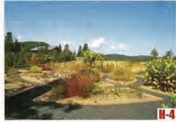
福井综合植物园 (越前町) 这里有从日本乃至世界各地收集的3,000多种植物, 是日本海侧最大规模的植物园。 ☎(0778)34-1120 ◎休息日 每周二