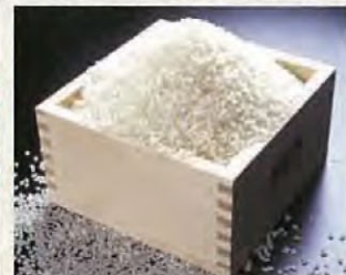
越光大米 美味大米的代名词—越光大米，最早产于福井。