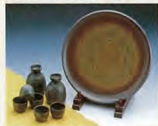
越前烧 越前烧是福井的名产，风格古朴，被认为是日本六大古窑之一。