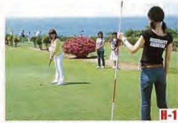
芝政世界 (坂井市) 这里有世界最大的推杆高尔夫球场等娱乐设施, 是大型的娱乐场所。 ☎(0776)81-2110