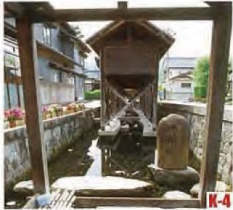
御清水 (大野市) 作为富有风味的水受到青睐, 被指定为“名水一百选”。