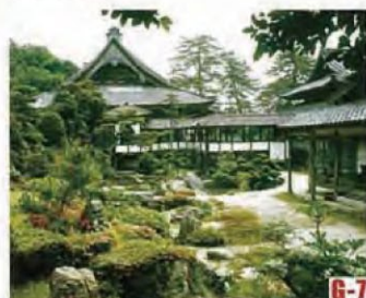
西福寺 (敦贺市) (红叶景点一百选) 红叶首屈一指, 一年四季风景俱佳。被指定为国家级名胜。 ◎红叶似火之时 10月下旬至11月中旬 ☎(0770)22-3926