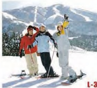
SKI JAM胜山 (胜山市) 设有西日本最大的滑雪场、MTB赛道等, 是个一年四季都能享受的休养场所。 ☎(0779)87-6109