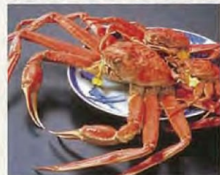
越前螃蟹 冬季新鲜极品。煮出来的螃蟹，格外美味。每年11月的螃蟹开蟹期，都有众多游客蜂拥而至。