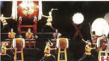
O·TA·I·KO响 (越前町) 日本大鼓的表演盛会。能够欣赏动人心弦的演奏。 ◎举办日期 8月中旬