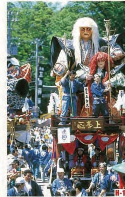
三国节 (坂井市) 载着高大武士偶人的彩车在街上行进的三国节是北陆三大节之一。 ◎举办日期 5月19日至5月21日