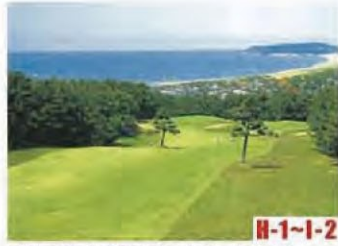
芦原温泉附近的高尔夫球场 (芦原市)