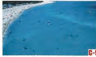
若狭和田海水浴场 (高滨町) 被选定为“舒适的海水浴场100选”。浩瀚的沙滩和极目远眺的蓝色大海尤为美丽。