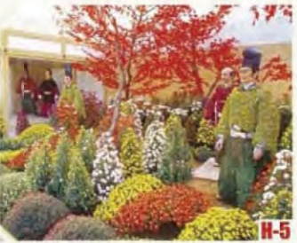
武生菊偶人 (越前市) 是秋季北陆特有的景物。菊花开得五彩缤纷。 ◎举办期间 10月至11月