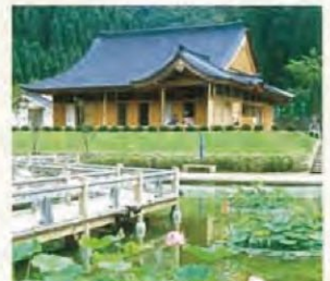
花莲公园 (南越前町) 世界各地的花莲争妍斗艳的南条花莲公园。7月上旬至8月上旬莲花节期间, 夜晚灯火通明。 ☎(0778)47-8002