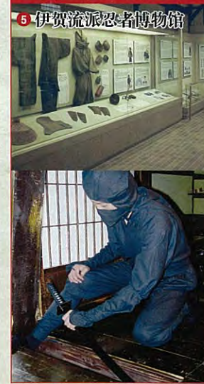
5 伊贺流派忍者博物馆