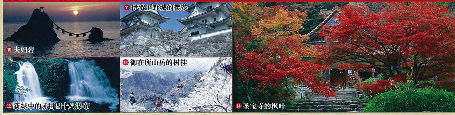
娱乐于自然风光之中,尽情享受三重县特有的度假活动 10 夫妇岩 11 伊贺上野城的樱花 12 新绿中的赤目四十八瀑布 13 御在所山岳的树挂 14 圣宝寺的枫叶 15 白山可可帕度假村 16 合欢之乡 17 海女小屋