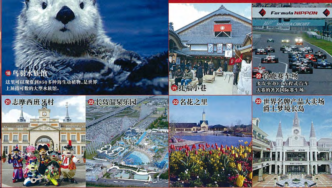
19 志摩西班牙村 20 铃鹿赛车场 多次举办F1方程式汽车大赛的著名国际赛车场。 21 长岛温泉乐园 22 名花之里 22 世界名牌产品大卖场 爵士梦境长岛