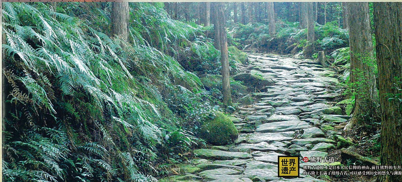
23 熊野古道 熊野古道原本是日本人民信仰的神山,前往熊野的参拜道的石阶上长满了青苔,可以感受到历史的悠久与渊源。 世界遗产