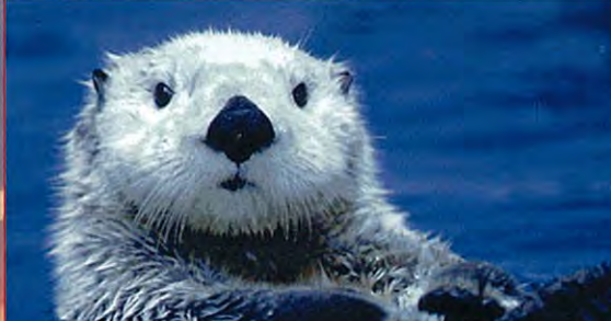
18 鸟羽水族馆 这里可以观赏到850多种海洋动植物,是世界上屈指可数的大型水族馆。