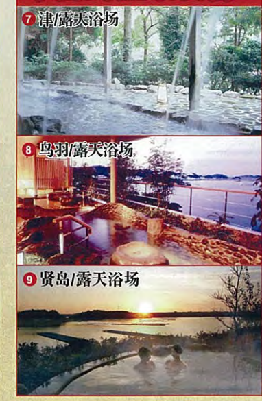
7 津/露天浴场 8 鸟羽/露天浴场 9 贤岛/露天浴场