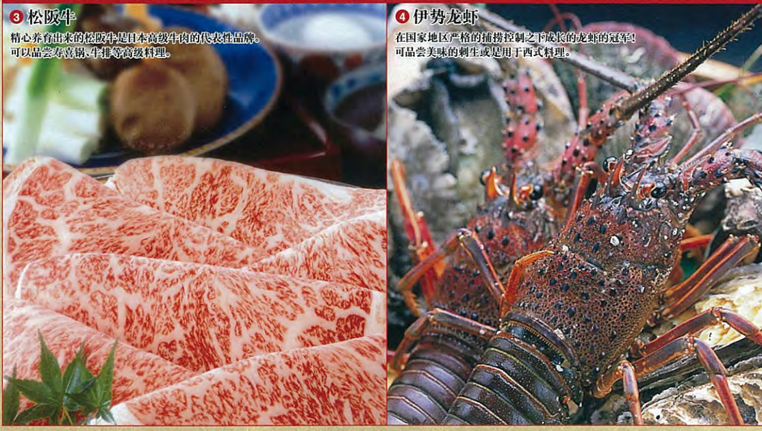
2 御木本珍珠岛 这里是御木本人工养殖珍珠成功的小岛。岛上展出世界各种名贵的珍珠。游客们还可以在这里选购丰富多姿的珍珠饰品。 3 松阪牛 精心养育出来的松阪牛是日本高级牛肉的代表性品牌。可以品尝寿喜锅、牛排等高级料理。 4 伊势龙虾 在国家地区严格的捕捞控制之下成长的龙虾的冠号。可品尝美味的刺生或是用于西式料理。