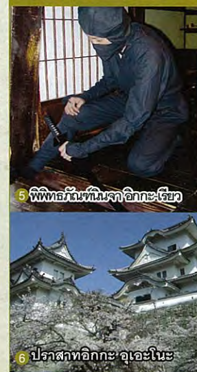
5 พิพิธภัณฑ์นินจา อิกกะ-เรียว 6 ปราสาทอิกกะ อะเอะโนะ