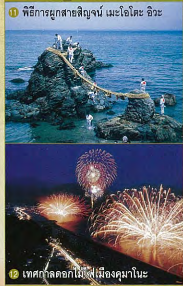
11 พิธีการผูกสายสิญจน์ เมะโอโตะ อิวะ 12 เทศกาลดอกไม้ไฟเมืองคามาโตะ

มีประสบการณ์กับประวัติศาสตร์ญี่ปุ่น ผ่านการเข้าชม Townscapes ที่เต็มไปด้วยวัฒนธรรมในอดีตเทศกาลและประเพณีวัฒนธรรมดั้งเดิม