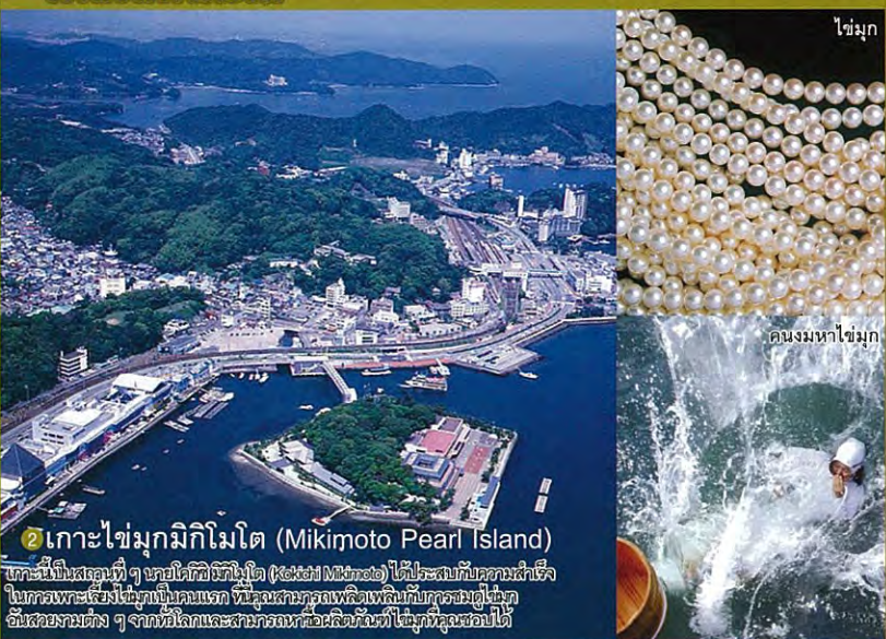
2 เกาะไข่มุกมิกิโมโตะ (Mikimoto Pearl Island) เกาะนี้เป็นสถานที่ ที่เคยใช้เป็นที่ฝังศพ (Island of Mikimoto) ได้ประสบกับความล้มเหลวในการเพาะเลี้ยงไข่มุกเป็นครั้งแรก ที่ซึ่งคนทุกคนเพลิดเพลินกับความสุขอันเรียบง่ายต่าง ๆ จากทั่วโลกและสามารถที่จะเพลิดเพลินกับไข่มุกที่สวยที่สุดในโลก ไข่มุก คองงมหาไข่มุก