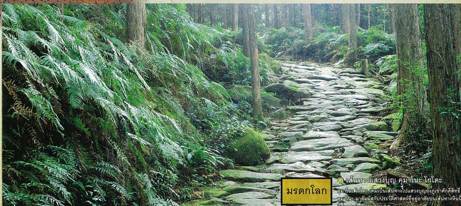
20 เส้นทางแสวงบุญ คามาโตะ โกะโตะ คามาโตะ โกะโตะ เดิมเป็นเส้นทางไปแสวงบุญของชาวคริสต์ที่คามาโตะ มาสัมผัสกับประวัติศาสตร์ที่อยู่อาศัยบนเส้นทางหินที่ปกคลุมไปด้วยหญ้าและดอกไม้ มรดกโลก