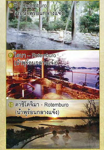
8 ฟูจิ - Rotemburo (น้ำพุร้อนกลางแจ้ง) 9 โตบา - Rotemburo (น้ำพุร้อนกลางแจ้ง) 10 คาชิโคจิมา - Rotemburo (น้ำพุร้อนกลางแจ้ง)