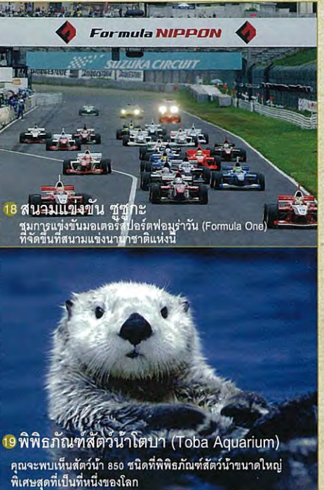
18 สนามแข่งขาน ซูซูกะ ชมการแข่งขันมอเตอร์สปอร์ตฟอร์มูล่าวัน (Formula One) ที่จัดขึ้นที่สนามแข่งนานาชาติแห่งนี้ 19 พิพิธภัณฑ์สัตว์น้ำโตบา (Toba Aquarium) คุณจะพบเห็นสัตว์น้ำ 850 ชนิดที่พิพิธภัณฑ์สัตว์น้ำขนาดใหญ่พิเศษที่สุดที่เป็นหนึ่งของโลก