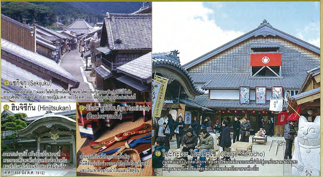
13 เซกิจูกุ (Sekijuku) ถนนคางาโตะโกโด (Kagado) มีต้นโคมไฟเมงุ และโคมไฟโทมูริที่ประดับประดาด้วยโคมไฟที่มีรูปแบบที่งดงามในสมัยเอโดะ (Edo) ของญี่ปุ่น (ค.ศ. 1603 ถึง ค.ศ. 1868) ที่เชื่อมกับถนนสายหลักแห่งหนึ่ง 14 อินจิชิกัน (Hinjitsukan) อาคารเก่าแก่ที่สร้างขึ้นเป็นหลุมฝังศพและที่ฝังศพของโชกุนโทกูงาวะ อิเอยาซุ (ค.ศ. 1603-1616) และโชกุนโทกูงาวะ อิเอยาซุ (ค.ศ. 1688 ถึง ค.ศ. 1712) 15 อิกกะ คุมิฮิเมะ (Iga Kumihimo) (ศิลปะลายเส้น) เป็นผลิตภัณฑ์หัตถกรรมที่ขึ้นชื่อที่มีสีสันที่ปรากฏการตกแต่งลายเส้นที่ละเอียดและงดงาม 16 โอะกะเงะ โอะกะเงะ (Okage-Yokocho) ถนนที่ขึ้นชื่อในอดีตได้ถูกจำลองสร้างขึ้นใหม่ตามแบบฉบับที่ปรากฏในภาพวาดที่โด่งดังที่สุดของเมืองเอโดะ

มีประสบการณ์กับประวัติศาสตร์ญี่ปุ่น ผ่านการเข้าชม Townscapes ที่เต็มไปด้วยวัฒนธรรมในอดีตเทศกาลและประเพณีวัฒนธรรมดั้งเดิม