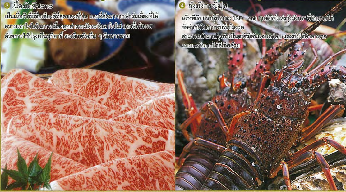
3 เนื้อมัตสึชิมะ เป็นเนื้อหอยที่มีชื่อเสียงที่สุดของญี่ปุ่น และที่ได้รับความนิยมสูงที่สุดที่ให้ความอร่อยในการรับประทานที่สมบูรณ์แบบ 4 กุ้งมังกรญี่ปุ่น หรือที่เรียกว่าลิวเอะ (ISE - eb) “กะบิชิแห่งกุ้งมังกร” ที่จับโดยได้ข้อจำกัดในการจับที่เข้มงวด สามารถนำมาปรุงทำเป็นอาหารอันแสนอร่อย และยังใช้ทำอาหารแบบตะวันตกได้หลากหลาย