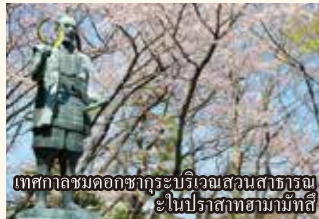
เทศกาลชมดอกซากุระบริเวณสวนสาธารณะ ในปราสาทฮามามัตสึ