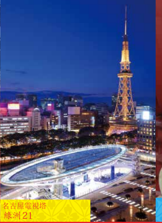
名古屋電視塔 綠洲21