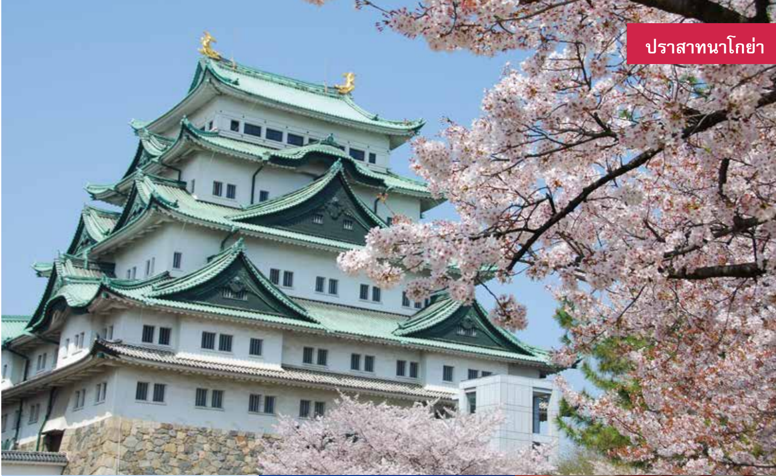
ปราสาทนาโกย่า

ประตูสู่การท่องเที่ยว "ภูมิภาคจูบุ / ประเทศญี่ปุ่น"