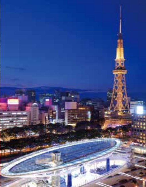
นาโกย่า ทิว ทาวเวอร์ โอเอซิส 21