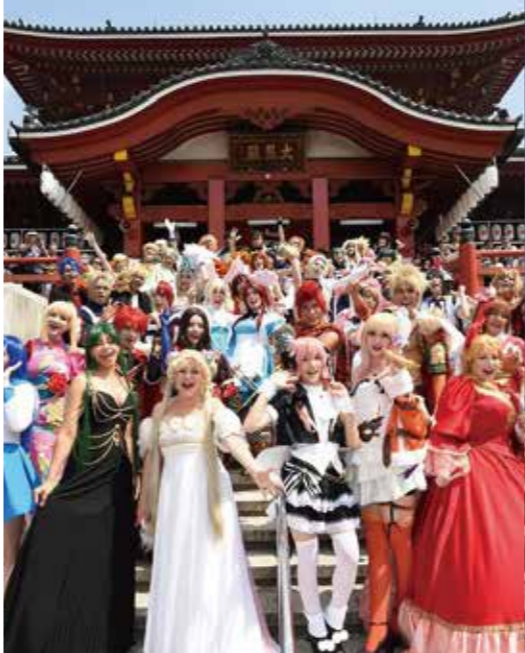
งานประกวดคอสเพลย์ระดับโลก